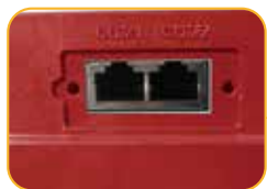
• Terminal Kommunikation Schnittstelle